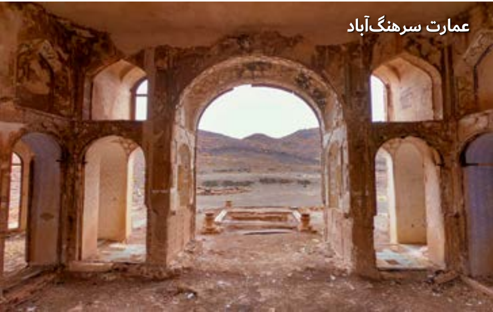
عمارت سرهنگ آباد