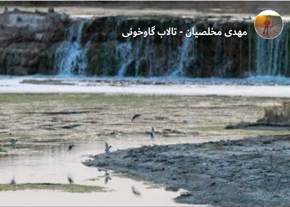
مهدی مخلصیان - تالاب گاوخونی