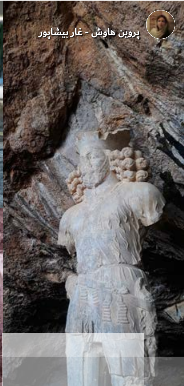
پروین هاوش - غار بیشاپور