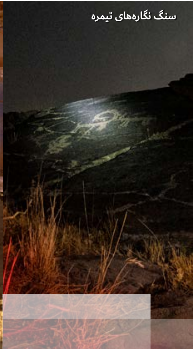
سنگ نگاره های تیمره