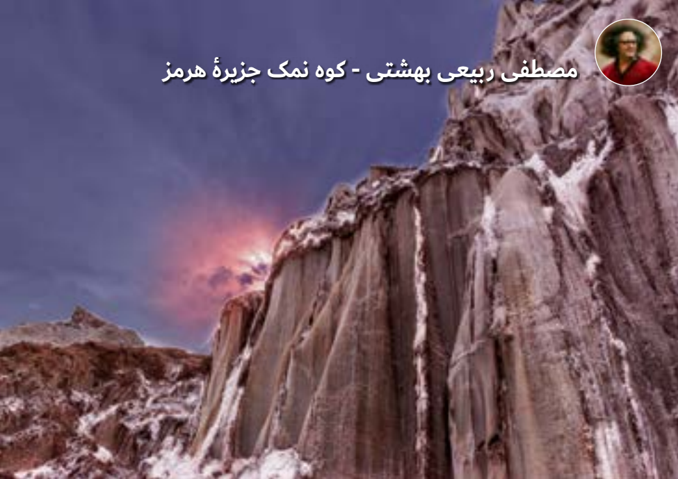
مصطفی ربیعی بهشتی - کوه نمک جزیره هرمز